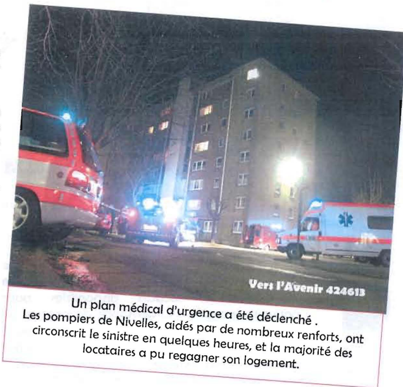
Vers l'Avenir 424613 Un plan médical d'urgence a été déclenché. Les pompiers de Nivelles, aidés par de nombreux renforts, ont circonscrit le sinistre en quelques heures, et la majorité des locataires a pu regagner son logement.

Au total, 13 personnes intoxiquées par la fumée ont été conduites à l'hôpital d'où, heureusement, elles sont sorties dès le lendemain.