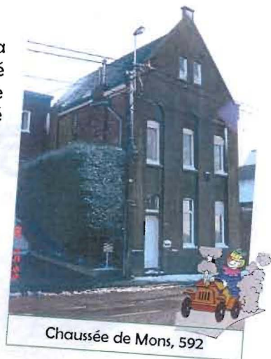
Chaussée de Mons, 592

En collaboration avec la Fabrique d'Eglise qui l'a cédée sous bail emphytéotique, ce bâtiment va être transformé en 3 appartements grâce à un subside de 150.000 € (htva).