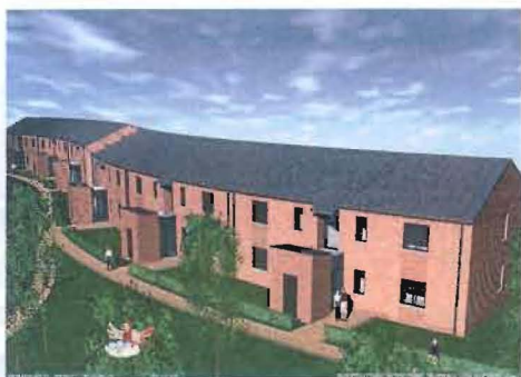
Rue Colson (derrière le C.P.A.S.)