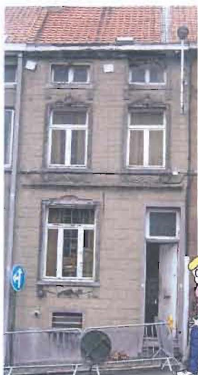
Rue du château, 16

En partenariat avec le CPAS brainois qui l'a cédée sous bail emphytéotique, la Société va rénover cette maison grâce à une subvention de 65.250 € (htva)