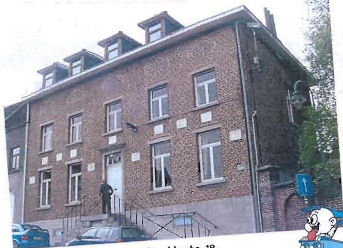
Rue Haute, 18