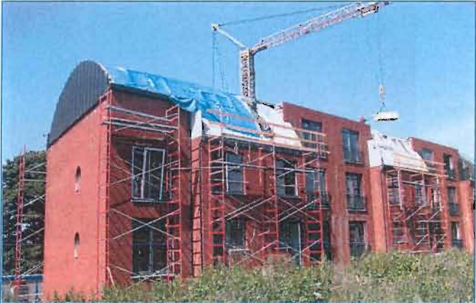
14 appartements sociaux et 10 appartements moyens avec garages sont en voie d'achèvement.