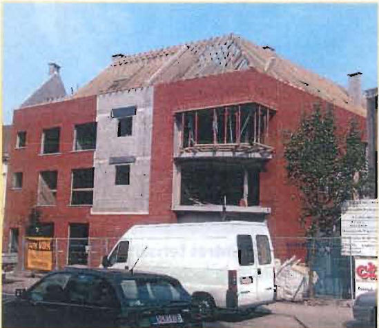
11 appartements sont érigés au-dessus d'un espace commercial.