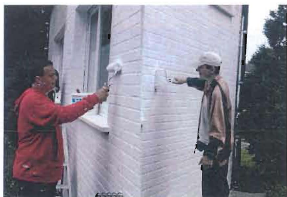
Les apprentis peintres terminent leur stage en rafraîchissant le local des pensionnés du parc de la Maillebotte.