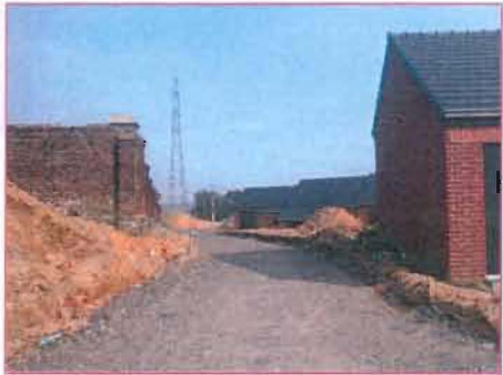
Les travaux de voiries sont en cours.