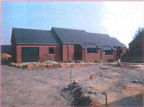
12 maisonnettes pour Seniors sont construites à la rue du Cimetière.